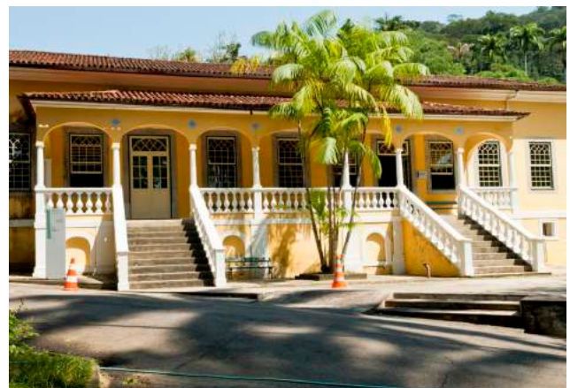
Solar da Imperatriz, Escola Nacional de Botânica Tropical (ENBT)

A conquista se deve aos sete anos de excelência do curso como Mestrado profissional e à nota 4 dada pela CAPES. Comemoramos todo o potencial acadêmico da ENBT!